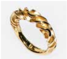
Fremstillet i 585 ‰ guld. Nr. 233333G