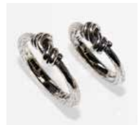
Fremstillet i 925 ‰ sølv. Nr. 237378

Inspireret af fundet Sejerøskatten dateret til år 900 e. Kr.