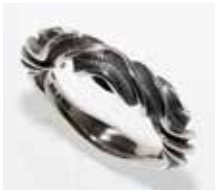
Fremstillet i 925 ‰ sølv. Nr. 233333

Er inspireret af bronzealder halsringe udstillet på Nationalmuseet