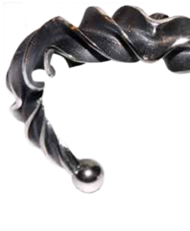
Fremstillet i 925 ‰ sølv. Nr. 25822